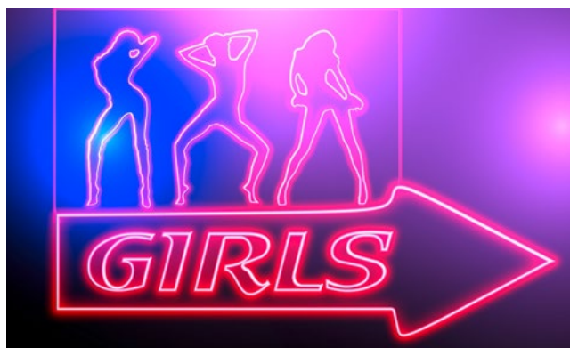
Les femmes et les filles représentent 99% des victimes du travail forcé dans l'industrie du sexe