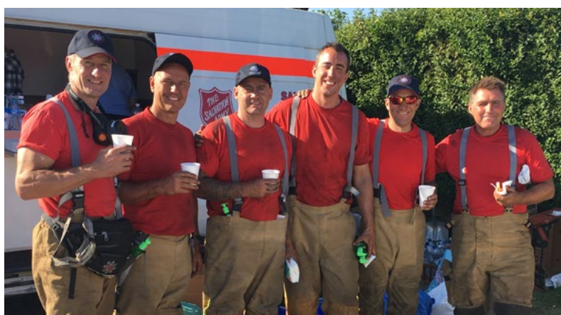
À Saddleworth Moor, Angleterre, les pompiers reprennent des forces grâce au ravitaillement organisé par l'Armée du Salut

En Colombie-Britannique (Canada), 18 unités communautaires d'intervention d'urgence, équipées de poêles, de réfrigérateurs et de grils, sont sur les lieux depuis que les incendies ont touché des communautés autour d'Okanagan. « Nous avons une position unique