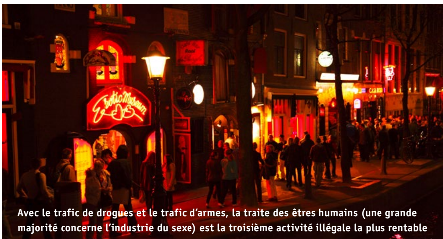
Avec le trafic de drogues et le trafic d'armes, la traite des êtres humains (une grande majorité concerne l'industrie du sexe) est la troisième activité illégale la plus rentable

La Convention du Conseil de l'Europe sur la lutte contre la traite des êtres humains (TEH) la définit comme étant « le recrutement, le transport, le transfert, l'hébergement ou l'accueil de personnes, par la menace de recours, le recours à la force ou à d'autres formes de contrainte, par enlèvement, fraude, tromperie, abus d'autorité. Une situation de vulnérabilité, l'offre ou l'acceptation de paiements ou d'avantages pour obtenir le consentement d'une personne ayant autorité sur une autre aux fins d'exploitation. L'exploitation comprend, au