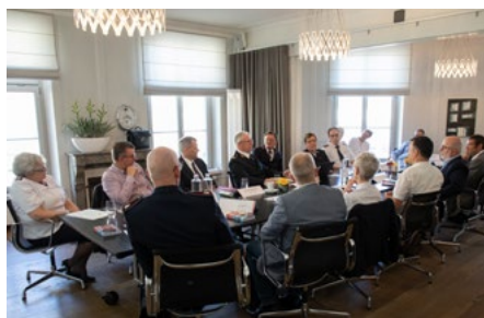
Le Général Brian Peddle et la commissaire Rosalie Peddle en discussion avec des responsables des Églises.