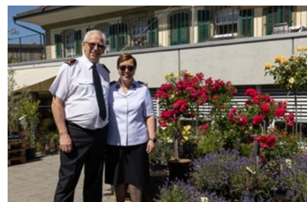
Les invités particuliers ont admiré la diversité florissante au Foyer & Ateliers Buchseegut, avant de se rendre au festival « Out of the Box » à Thoune.