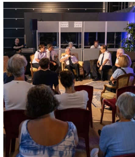
« Talklounge » : en discussion avec les Cheffes et Chefs de l'Armée du Salut.