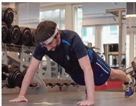
Que ce soit des pompes...

Le comité d'organisation est ravi et dit : merci beaucoup pour votre participation !