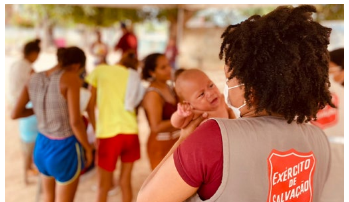
Au Brésil, l'Armée du Salut apporte son soutien à des familles, des enfants et des sans-abri touchés par la pauvreté et la précarité.