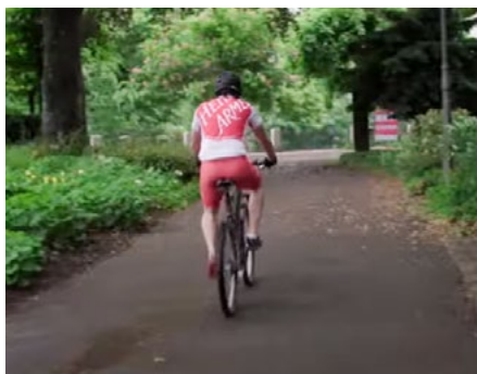
... le vélo...

Le prochain « meet & move » aura lieu les 17 et 18 juin 2023 au centre sportif de Lyss.