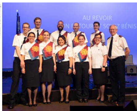
Les nouvelles officières et nouveaux officiers lors de la Consécration, en compagnie du Général et de la Commissaire.

Pour conclure le festival, le Général a béni tous les participants avec une prière. Il nous a assuré : « Nous garderons ce moment vécu ici comme une inspiration et un encouragement. »