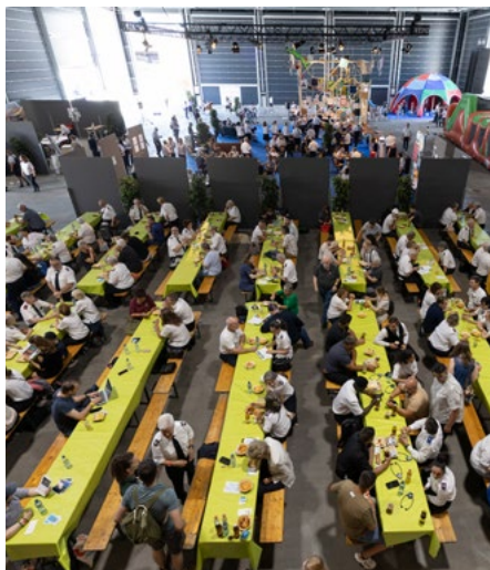
Moments de communion et d'échange lors de repas ...