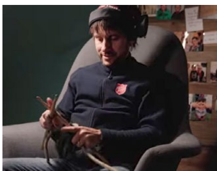
... ou le tricot :