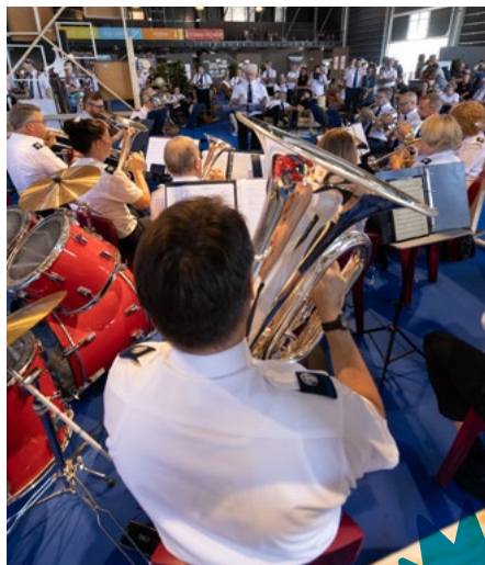
... et de concerts au « Village » du centre d'exposition à Thoune.