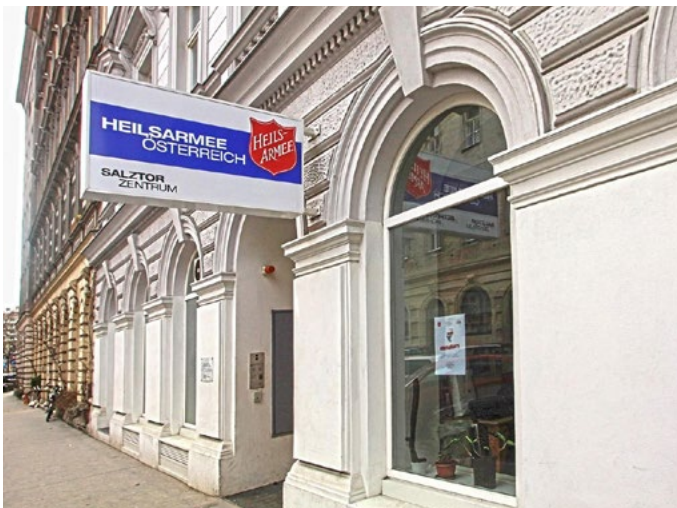
La « maison de la deuxième chance » au cœur de Leopoldstadt offre un chez-soi digne et temporaire à des hommes adultes sans domicile.